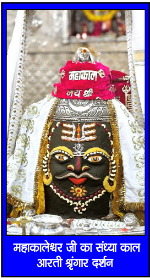
महाकालेश्वर जी का संख्या काल आरती श्रृंगार दर्शन