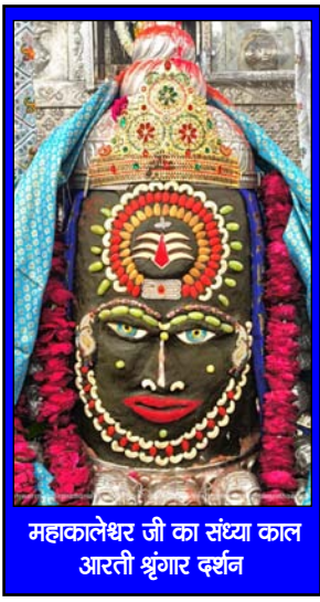
महाकालेश्वर जी का संस्था का आरती श्रृंगार दर्शन