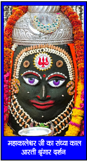
महाकालेश्वर जी का संध्या काल अरवली श्रृंगार दर्शन