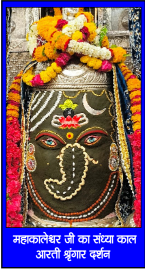
महाकालेश्वर जी का संस्था काल आरती श्रृंगार दर्शन

हमारी कहानी का अहम हिस्सा तब होता है जब जड़े विकसित होती हैं, न की जब फूल खिलते हैं।