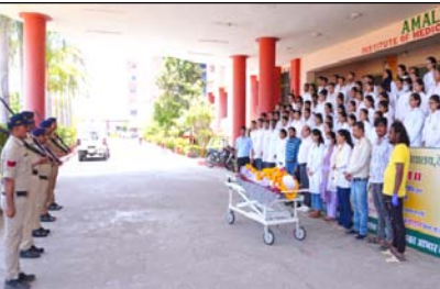
की संरचना का ज्ञान आवश्यक है, और शरीर दान भावी चिकित्सकों के निर्माण में महत्वपूर्ण योगदान है। यह अमूल्य सहयोग विद्यार्थियों के व्यावहारिक अध्ययन और चिकित्सा विज्ञान के ज्ञानार्जन के लिए अत्यंत महत्वपूर्ण है।