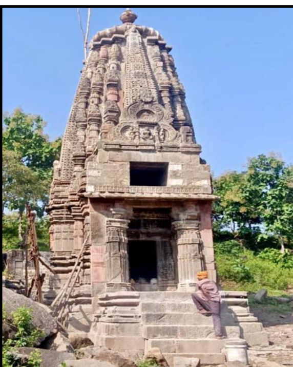
और पुनर्जीवन का महत्वपूर्ण प्रयास है। देवबड़ला और आशापुरी क्षेत्र पुरातात्विक पुनरुद्धार के

भोपाल/ दैनिक मालवा हेराल्ड। मुख्यमंत्री डॉ. मोहन यादव ने कहा है कि प्रदेश की सांस्कृतिक एवं ऐतिहासिक धरोहरें भावी पीढ़ियों को समृद्ध अतीत से जोड़ने का महत्वपूर्ण माध्यम हैं। साथ ही हमारे गौरवशाली इतिहास, ज्ञान, कला और सभ्यता की जीवंत प्रतीक हैं। इन धरोहरों का संरक्षण एवं संवर्धन समय की आवश्यकता है, जिससे भावी पीढ़ियां भी अपनी सांस्कृतिक विरासत पर गर्व का अनुभव कर सकें। राज्य सरकार -विरासत भी- विकास भी- के संकल्प को साकार करते हुए सांस्कृतिक धरोहरों के संरक्षण के साथ धार्मिक एवं सांस्कृतिक पर्यटन को भी बढ़ावा दे रही है। प्रदेश में प्राचीन मंदिरों एवं ऐतिहासिक धरोहरों के संरक्षण और पुनरुद्धार कार्य निरंतर किया जा रहा है। इन प्रयासों से स्थानीय स्तर पर रोजगार के अवसर सृजित हो रहे हैं और नई पीढ़ी को अपनी समृद्ध सांस्कृतिक विरासत से जुड़ने का अवसर प्राप्त हो रहा है।