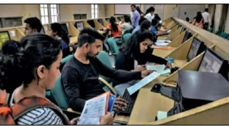
पहनने की अनुमति है। एडवाइजरी में क्या-क्या है- एडवाइजरी में

नई दिल्ली/ जीएनएस। कामन यूनिवर्सिटी एटेंस टेस्ट (सीयूईटी-यूजी) 2026 में शामिल होने वाले उम्मीदवारों को अपनी आस्था से जुड़ी चीजें या वस्त्र पहनने की अनुमति होगी, बशर्ते वे तलाशी के लिए केंद्र पर काफी पहले पहुंच जाएं।