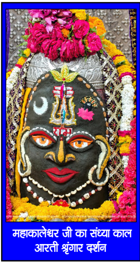
महाकालेश्वर जी का संघात काल आरती श्रृंगार दर्शन