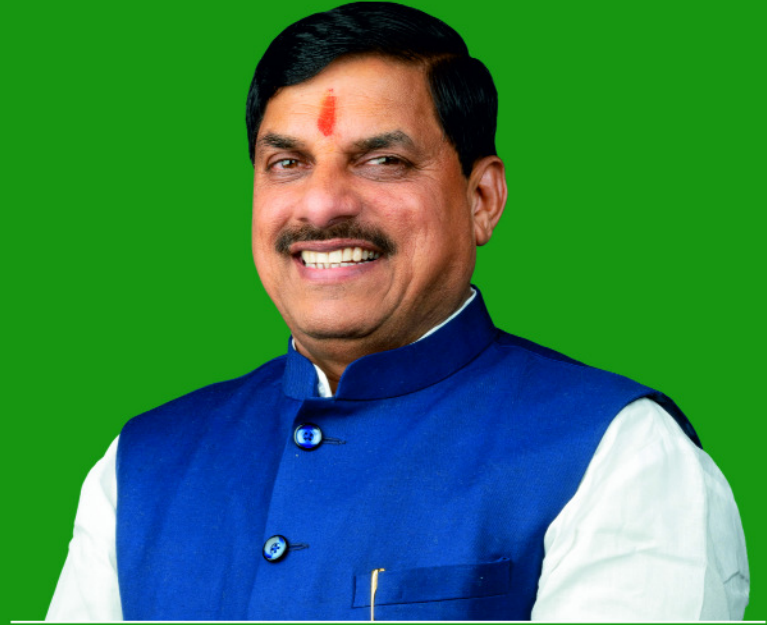
डॉ. मोहन यादव, मुख्यमंत्री