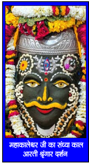
महाकालेश्वर जी का संघाट काल आरती श्रृंगार दर्शन

जिनका स्वभाव अच्छा होता है उन्हें कभी प्रभाव दिखाने की जरूरत नहीं होती है, मुस्कुराना, प्रशंसा करना, सहयोग करना, और क्षमा करना सुखी जीवन के मूलमंत्र हैं!