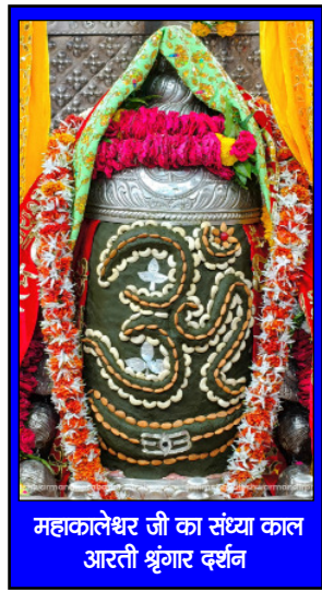
महाकालेश्वर जी का संध्या काल आरवली श्रृंगार दर्शन

फिर से कोशिश करने से मत डरो क्योंकि, इस बार आपकी शुरुआत अनुभव से होगी, शून्य से नहीं.....!