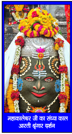
महाकालेश्वर जी का संस्था काल आरती श्रृंगार दर्शन

'परिस्थितियाँ' कभी भी, 'समस्या' नहीं बनती 'समस्या' तभी बनती है जब, हमें 'परिस्थितियों' से 'निपटना' नहीं आता है...!