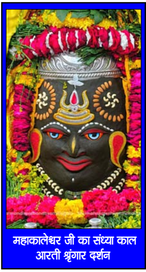
महाकालेश्वर जी का संस्था का आरती श्रृंगार दर्शन

जब हम किसी की मदद करते हैं, तब हमेशा याद रखिये, हम सिर्फ माध्यम हैं स्रोत नहीं..!