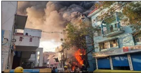
(5 से अधिक) मौके पर पहुंचीं। स्थानीय पुलिस ने इलाके को घेर लिया और बचाव कार्य शुरू किया। अग्निशमन दल अभी भी आग पर पूरी

तमिलनाडु/ जीएनएस। तमिलनाडु के कोयंबटूर शहर के कट्टर इलाके में शुक्रवार शाम एक बड़ी आग ने दहशत फैला दी। राजा रथिनम स्ट्रीट पर स्थित माथेश्वरी ऑटोमोबाइल नामक तीन-चार मंजिला इमारत में एक निजी ऑटोमोबाइल स्पेयर पार्ट्स की दुकान और गोदाम में आग लग गई, जो तेजी से फैल गई और पूरी इमारत को अपनी चपेट में ले लिया। आग लगने की सूचना मिलते ही तमिलनाडु फायर एंड रेस्क्यू सर्विस की कई दमकल गाड़ियां