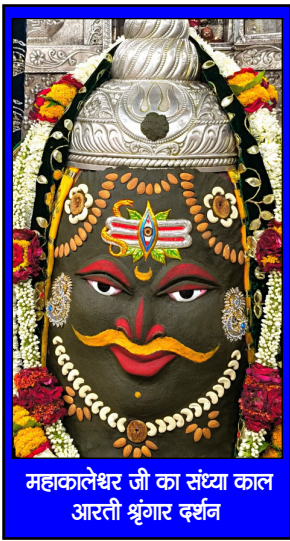
महाकालेश्वर जी का संस्था काल आरती श्रृंगार दर्शन