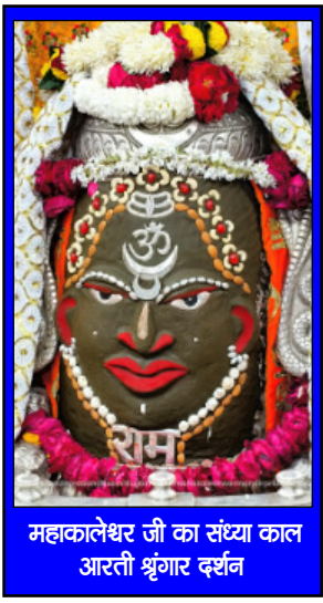
महाकालेश्वर जी का संस्था काल आरती श्रृंगार दर्शन

संस्कार और परवरिश बहुत मायने रखते हैं, सिर्फ पढ़ लिखकर कोई अच्छा आदमी नहीं बनता!