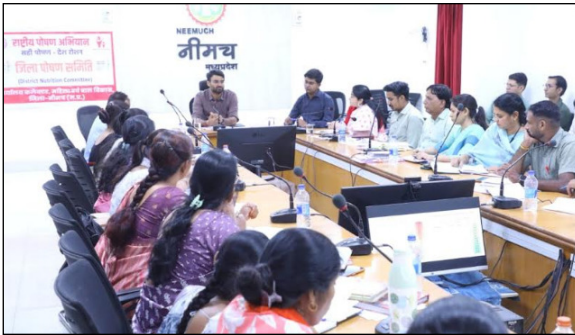
नियमित करें, पंजीयन से शेष 3 से 6 वर्ष के बच्चों को दर्ज करें। जिले में प्रतिमाह की जा रही आंगनवाड़ी कार्यकर्ता की ग्रैडिंग अनुसार कमजोर आंगनवाड़ी कार्यकर्ता का नियमित प्रशिक्षण आयोजित करें तथा कार्य नहीं करने या लापरवाही बरतने पर संबंधित के विरुद्ध कार्रवाई करें। एफ.आर.एस., आभा आई.डी., अपार आई.डी. के शेष कार्य 30 अप्रैल तक पूर्ण करें। वजन से एक भी बच्चा शेष न रहे।

शालापूर्व अनौपचारिक शिक्षा का अधिक प्रभावी आयोजन