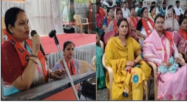
नीमच/ सतीश सैन/ दैनिक मालवा हेराल्ड। अधिनियम को लेकर विपक्ष ने महिलाओं के हक में खड़े महिलाओं के अधिकारों और राजनीतिक भागीदारी के मुद्दे होने के बजाय राजनीति की है। बड़ी संख्या में जुटीं

पर अब सियासी तापमान बढ़ता नजर आ रहा है। शनिवार को भारतीय जनता पार्टी के जिला कार्यालय 'तपोभूमि' में आयोजित महिला जन आक्रोश सम्मेलन इसी बढ़ते राजनीतिक टकराव का संकेत बन गया।