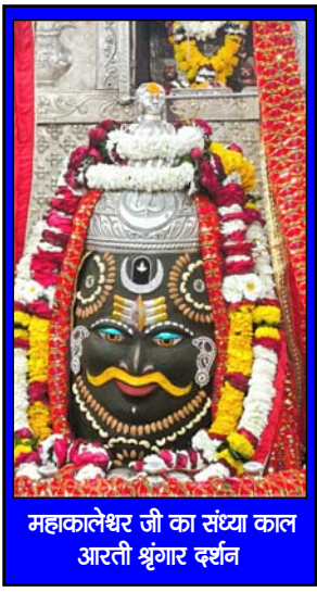
महाकालेश्वर जी का संस्था का लाल आरती श्रृंगार दर्शन

इंसाज तब समझदार नहीं होता, जब वह बड़ी बड़ी बातें करने लगता है बल्कि समझदार तब होता है जब वह छोटी छोटी बातों को समझने लगता है