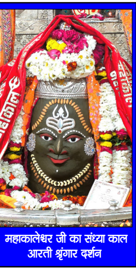
महाकालेश्वर जी का संस्था काल आरती श्रृंगार दर्शन