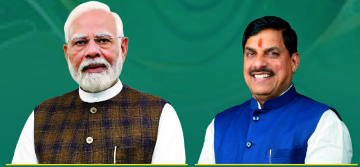
नरेन्द्र मोदी प्रधानमंत्री

शिप्रा तीर्थ परिक्रमा के श्रद्धालुओं की उपस्थिति में माँ शिप्रा को 351 फुट की चुनरी अर्पण की जायेगी। साथ ही हरिकथा, भक्ति संगीत तथा भारतीय नौसेना बैंड की प्रस्तुति भी होगी।