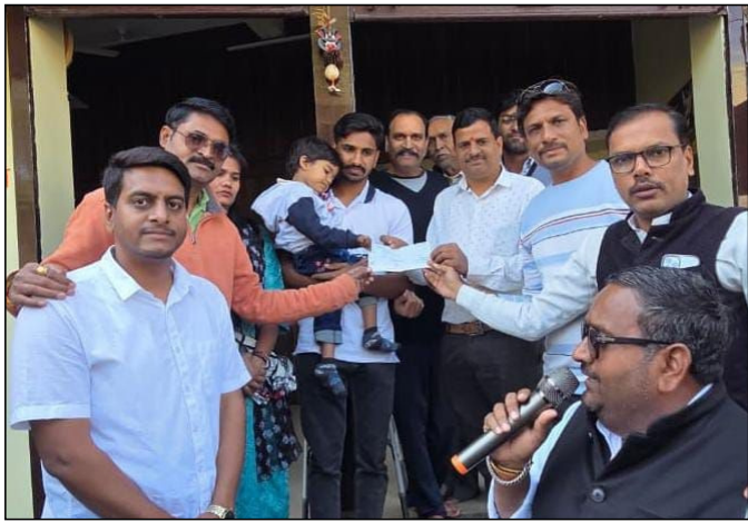
को सामूहिक संवेदना का प्रतीक बना। सब्जी मंडी, सफल बनाया। जन सहयोग यात्रा को सफल बनाने में

जन सहयोग यात्रा के दौरान नगर और ग्रामीण अंचलों के नागरिकों, व्यापारियों, सामाजिक संगठनों एवं पत्रकार साधियों ने बढ़-चढ़कर भाग लिया। यह सहयोग केवल आर्थिक नहीं, बल्कि एक मासूम जीवन को बचाने के लिए समाज