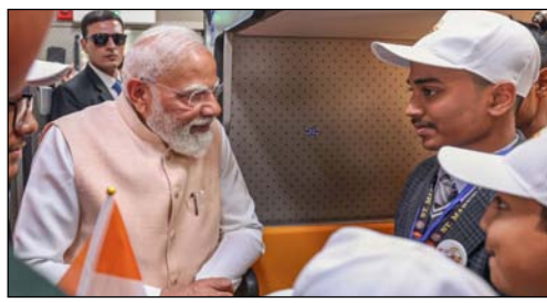
बार बंगाल का मतदाता भी भाजपा को ही चुनेंगे। मालदा में विशाल जनसमूह को संबोधित करते

नई दिल्ली/ जीएनएस। बीएमसी में जीत के बाद भाजपा के नेताओं में गजब का जोश देखने को मिल रहा है। शनिवार को पश्चिम बंगाल के मालदा में दौरे पर पहुंचे प्रधानमंत्री मोदी ने भी कार्यक्रमों से बीएमसी की जीत के बाद बंगाल जीत की तैयारी करने को कहा। बीएमसी की जीत में युवा पीढ़ी के योगदान का जिक्र करते हुए पीएम ने कहा कि भारत का जेनजी भाजपा के विकास के मांडल पर भरोसा करता है। उन्होंने कहा कि जिस तरह से भाजपा को बीएमसी में रिकॉर्ड तोड़ जीत मिली है, वैसे ही इस