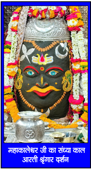
महाकालेश्वर जी का संस्था का आरती श्रृंगार दर्शन

जब तक इंसान खुद पर भरोसा नहीं करता.. तब तक छोटी सी मुश्किल भी 'पहाड़' लगती है..