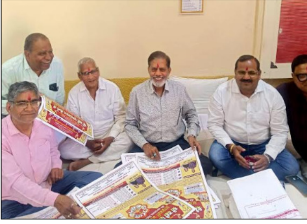
प्रभावी आराधना है, जिसमें साधक नौ दिनों तक मयणासुंदरी ने नवपद ओली की आराधना कर