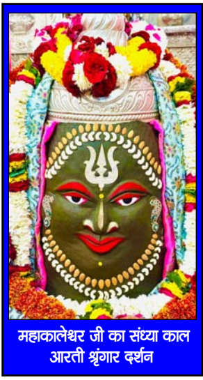
महाकालेश्वर जी का संस्था काल आरती श्रृंगार दर्शन

निर्मय वही हैं, जो सत्य की धरण में हैं, जो असत्य का सहारा लेते हैं वो हमेशा भय में रहते हैं