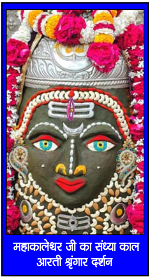
महाकालेश्वर जी का संख्या काल आरती श्रृंगार दर्शन

गलतियाँ हर एक से होती हैं, कुछ जानते नहीं और कुछ मानते नहीं !